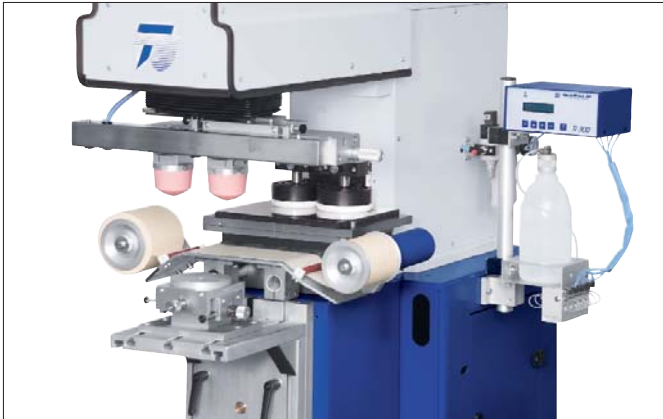
Verschiebetisch VT 602 und Koordinatentisch KT 50 an TPX 200 Shuttle table VT 602 and coordinate table KT 50 on a TPX 200