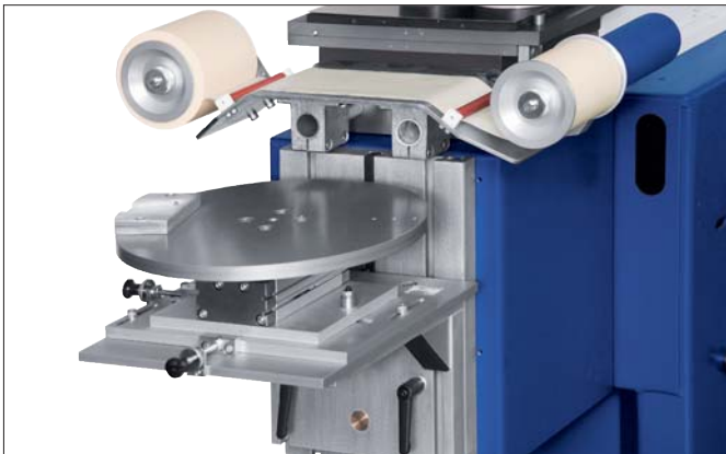
TPX 201 mit Maschinensockel MS 252, Verschiebetisch VTP 400, Tamponreinigung TAC und Koordinatentisch KT 30

TPX 201 on the machine base MS 252 with the shuttle table VTP 400, pad cleaning device TAC and coordinate table KT 30